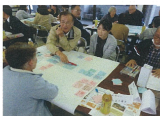
小グループに分かれて、活発な意見交換

中部地域包括支援センターの圏域ケア推進会議、生活支援体制整備事業の第2層協議体、地区福祉推進組織である東八田福祉懇談会との共同企画で、東八田地区の助け合いをすすめる会を11月13日(水)に東八田公民館で開催しました。今回は、サロンむくろじ、東八田民生児童委員協議会、上杉駐在所からの活動報告とワークショップを行い、「身近な助けあい」をテーマに意見交流を行いました。