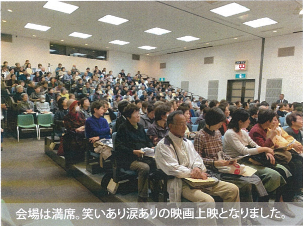
会場は満席。笑いあり涙ありの映画上映となりました。

この映画の舞台は、広島県呉市。信 友監督の老親の日常を描いたもので した。ドキュメンタリー制作に携わる