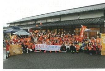
雨の中グンゼスクエアで

RUN伴(ランとも)は、認知症になっても安心して暮らせる地域づくりをめざして、日本全国をタスキでつないで走る啓発イベントです。今回、京都北部では初めて実施され、3歳から83歳までの76人がエントリーし、約200人が応援参加していただきました。あいにくの雨の中でしたが、福知山と舞鶴からそれぞれタスキをつなぎ、ゴール地点であるグンゼスクエアまで無事到着することができました。認知症の人もそうでない人も、介護や医療の現場で働く人も、認知症サポーターなど市民の方も、みんなで盛り上がった一日でした。