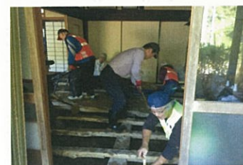
床下の土砂を掻き出す

台風21号は市内でも被害がありましたが、奥上林地区の古和木では、大雨の影響で土砂が家屋に流入し、自治会での復旧作業もままならないということから、綾部市災害ボランティアセンターではボランティアを募集し、10月27日と28日の2日間、のべ31名のボランティアを派遣し、地元自治会と協働で支援活動を行いました。