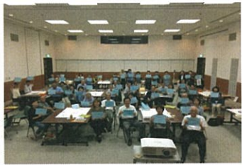
参加者の思いを出し合う

今年度、本会が綾部市から受託した生活支援体制整備事業の一つとして、「あやべのたすけあいを考える会」を9月13日(水)にI・Tビルで初めて開催しました。既存の医療や介護サービスだけでなく、自治会や民間企業、NPOなどが連携し、助け合いの地域づくりを目指すもので、この日は、介護の必要な親と障害のある息子の世帯が地域から孤立している様子を描いた寸劇を本会の職員が披露し、そのあと43名の参加者で意見交換を行いました。